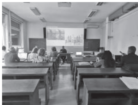
Slika 2. Projektni partneri na WAAT seminaru u Zagrebu