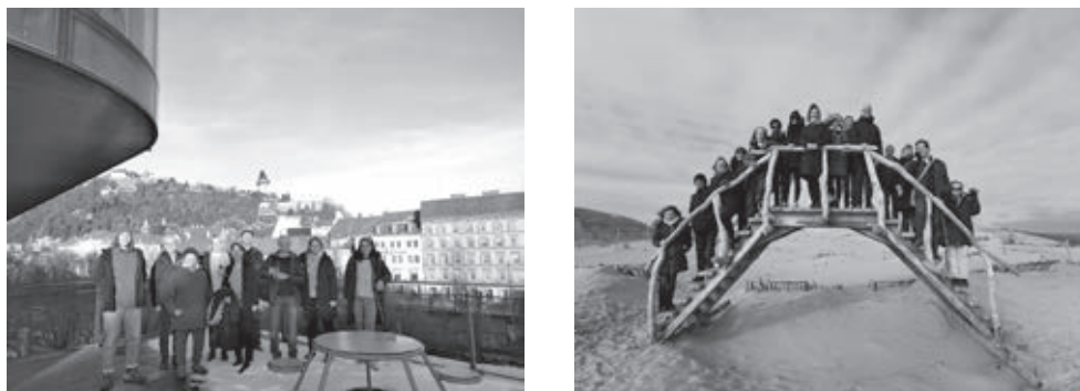
Slika 1. Projektni partneri na WAAT sastancima u Grazu i Plungèu

ustanove, institucije i organizacije s područja kulturne baštine, razne nevladine organizacije te zainteresirani pojedinci (slika 1).