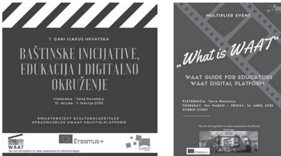
Slika 5. Plakati i materijali za 7. ICARUS dane u Pleternici

Sedme dane ICARUS-a u Hrvatskoj pod nazivom Baštinske inicijative, edukacija i digitalno okruženje ICARUS Hrvatska organizirao je u suradnji s Gradom Pleternica i Javnom ustanovom Pleternica, s konzorcijima ICARUS i DARIAH-HR te uz financijsku podršku Ministarstva kulture i medija RH (slika 5). Dvodnevni program održao se od 31. ožujka do 1. travnja 2022. u Interpretacijskom centru Terra Panonica u Pleternici u hibridnom formatu, na hrvatskom i na engleskom jeziku. Uz rezultate projekta WAAT na skupu su predstavljene i brojne aktualnosti iz AKM zajednice vezane uz digitalno pripovijedanje i podučavanje, umrežavanje i multimedijalno predstavljanje baštinskih izvora, različite digitalne baštinske platforme te različite kulturne i znanstvene mreže i inicijative. Program je obuhvatio 36 izlaganja s više od 50 predavača iz Hrvatske, Slovenije, Srbije, Austrije, Španjolske, Mađarske, Grčke i Italije, uz više od 150 sudionika od kojih je pedesetak sudjelovalo uživo, a stotinjak online .